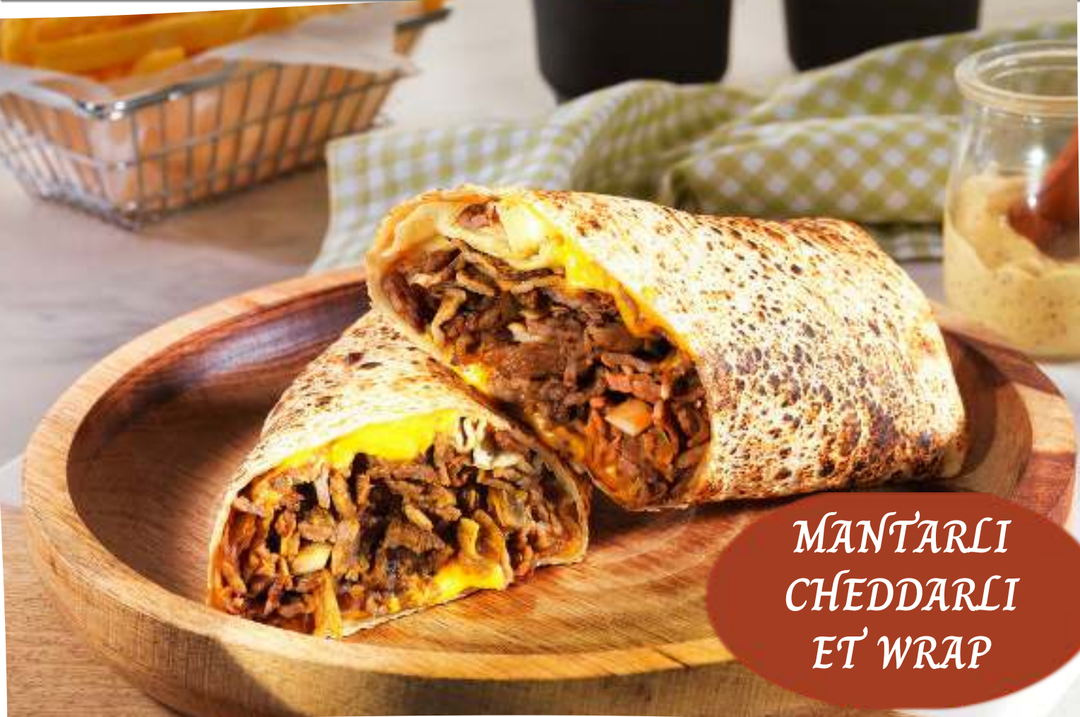
MANTARLI CHEDDARLI ET WRAP