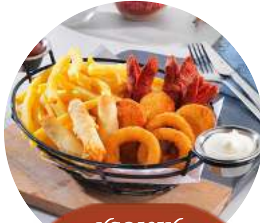
KARIŞIK KIZARTMA SEPETİ