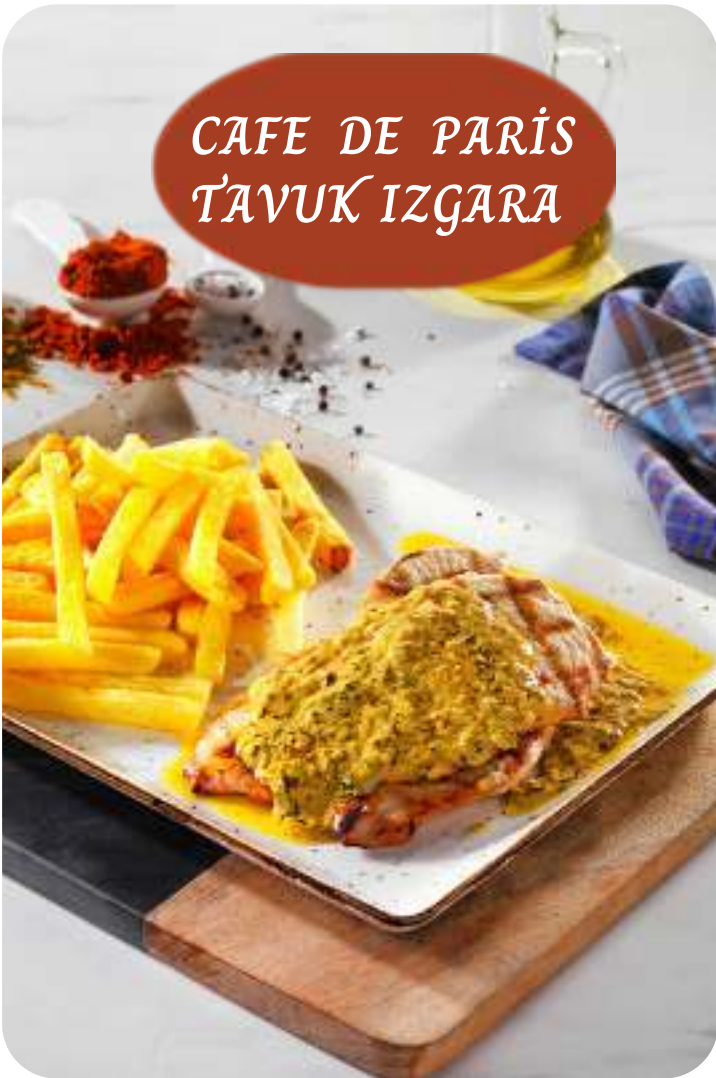
CAFE DE PARIS TAVUK IZGARA