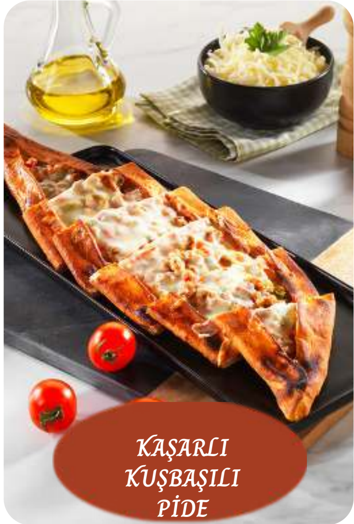
KAŞARLI KUŞBAŞILI PİDE