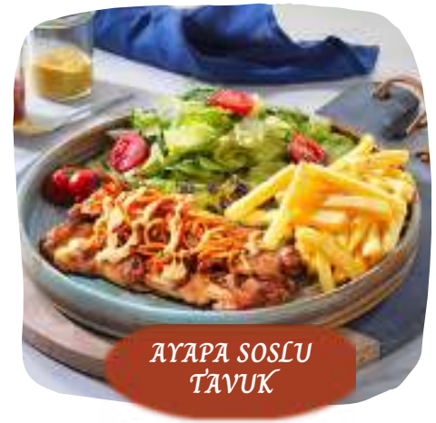
AYAPA SOSLU TAVUK

(Domates, Mozzarella, Fesleğen, Zeytinyağı)