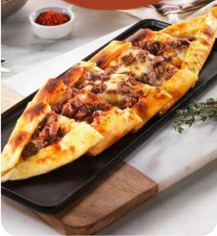
KAVURMALI KAŞARLI PİDE