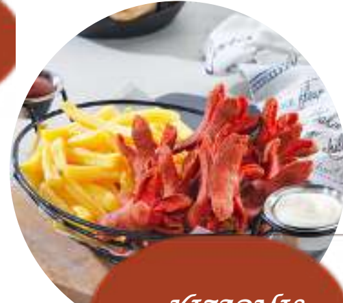
KIZARMIS SOSIS SEPETİ