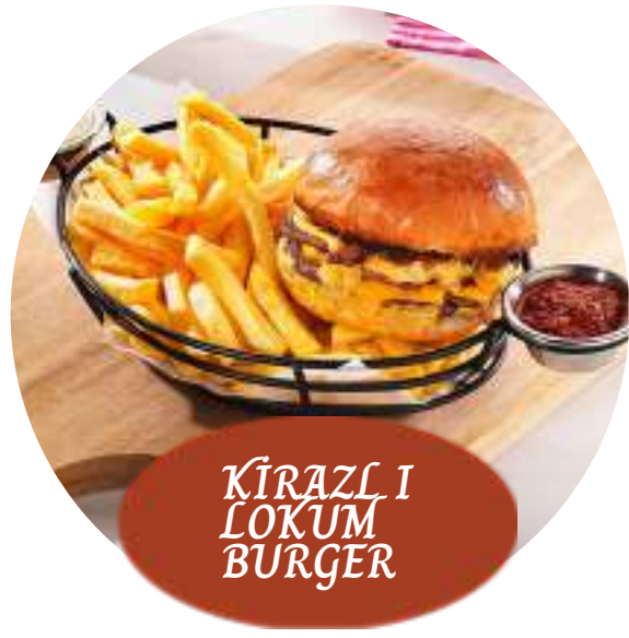
KIRAZLI LOKUM BURGER