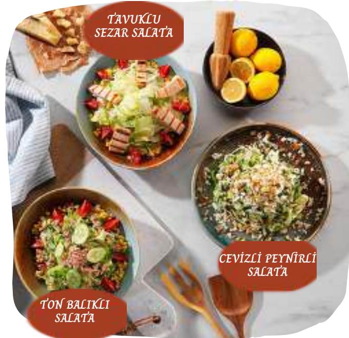
TAVUKLU SEZAR SALATA