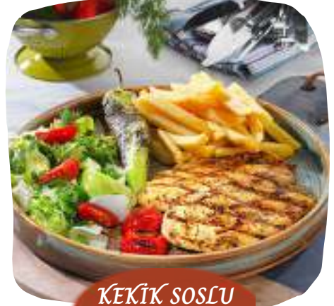
KEKİK SOSLU TAVUK